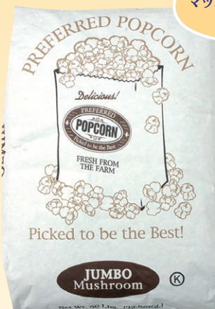
③ プレファード ジャンボマッシュルームポップコーン 22.67kg