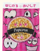
⑧ ポップコーン 100g