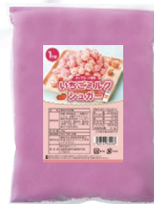
③ いちごミルクシュガー 1kg