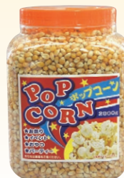
⑨ ボトルイン ポップコーン(大) 2800g