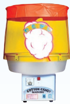
⑧ わたがし機 CA-7型