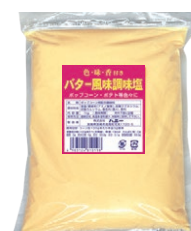
⑤ バター風味調味塩 1kg