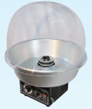
⑥ 綿菓子機 K-33型 バブルカバー付