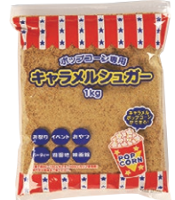
② キャラメルシュガー 1kg