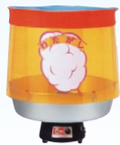
⑦ わたがし機 TK-5型