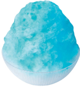
ハワイアンブルー