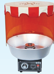
⑤ 綿菓子機 K-33型