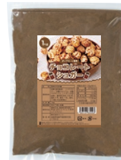
④ チョコレートシュガー 1kg