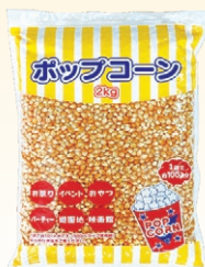
⑥ ポップコーン 2kg