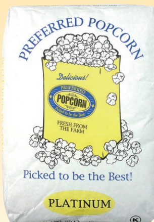
② プレファード ブラチナムポップコーン 22.67kg