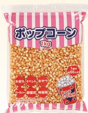
⑦ ポップコーン 1kg