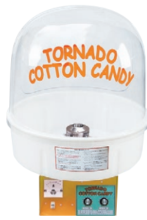
④ わたがし機 FC-10型