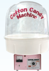
⑪ わたがし機 CA-120型 バブルカバー付