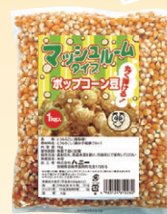
④ ポップコーン マッシュルーム 1kg