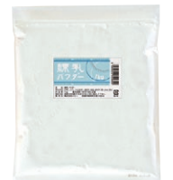
⑥ 練乳パウダー 500g