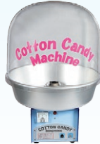
⑨ わたがし機 CA-7型 バブルカバー付き