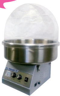
① 綿菓子機 TR-17