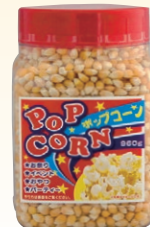
⑩ ボトルイン ポップコーン(中) 960g