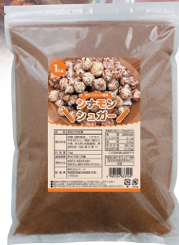
⑦ シナモンシュガー 1kg