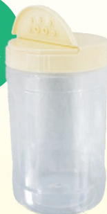
夢フル詰め替え容器