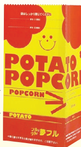
夢フル袋 スマイル