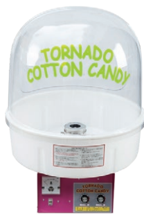
③ わたがし機 FC-8型