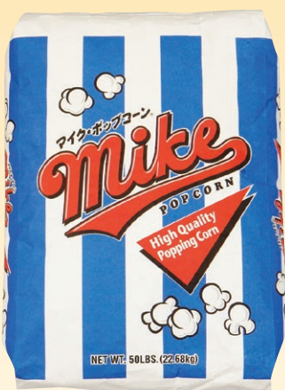
① マイクポップコーン 22.67kg