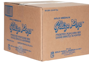
① キャラメルシュガー 22.67kg