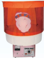
⑩ わたがし機 CA-120型