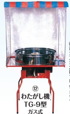
⑫ わたがし機 TG-9型 ガス式