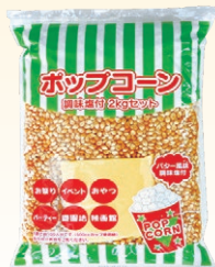
⑤ ポップコーン 調味塩付 2kgセット