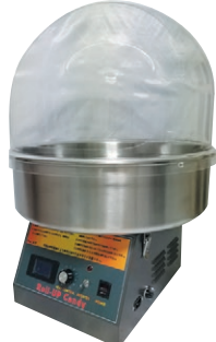
② 綿菓子機 TR-18