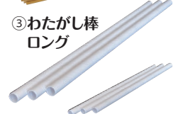
③ わたがし棒 ロング